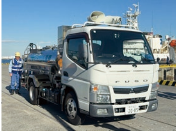
横浜市の所有する給水車(2~4t)

横浜市は、2~4tタンクの給水車を19台所有しているが、 およそ各区に1台しかない。果たしてこれで十分と言えるのか。