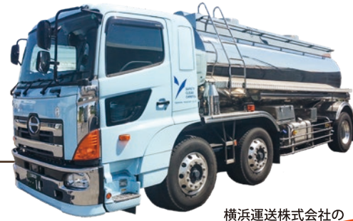
横浜運送株式会社 保有するタンクローリー車

飲料水を運搬可能な大型タンクローリー車(9t)を 保有する民間事業者と横浜市が協定を締結(令和7年3月6日)